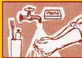
Регулярно мойте руки