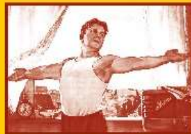
Ведите здоровый образ жизни