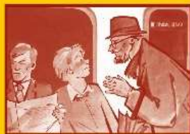
Ограничьте пребывание в местах скопления людей