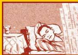
Избегайте контактов с заболевшими